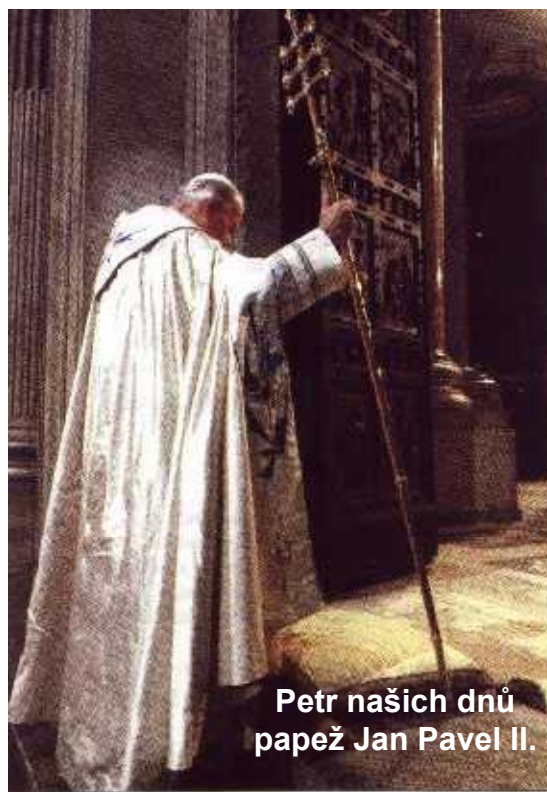
Petr našich dnů papež Jan Pavel II.

Tímto aktem se lidstvo odřeklo satanovy nadvlády a vzpoury a rozhodlo se pro Boha. Strhlo ze sebe jho zla a přimklo se k cestě vedoucí ke spáse. Dnešní den je vpravdě historický, neboť obrací směr lidských dějin, nastavený Adamovým pádem.