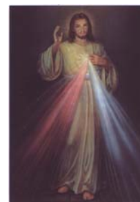
JEŽÍŠI, DŮVĚŘUJI TI!

BM-02 „Nikdo nesmí mít strach ke mně přijít, ani tehdy, kdyby jeho hříchy byly těmi nejzvrhlejšími. Jsem štedřejší k hříšníkům než ke spravedlivým, protože právě kvůli nim jsem na tuto zemi přišel.“ (Kristova slova, adresovaná sestře Faustíně) ■