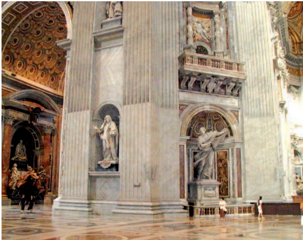
Колона Вероніки в Базиліці св. Петра; всередині якої міститься скарбниця.

нерукотворне зображення на тканині Обличчя Христа. Ця реліквія називалася «першою іконою», «хусткою з Камуліана», «мандиліоном з Едесси». Всі були переконані, що цей образ не був намальований людиною, тому він звався Acheiropoietos (Нерукотворний). Це була найбільш визначна реліквія, що зберігалася у Базиліці св. Петра в Римі. Багато прочан приходило сюди, щоб побачити «Плат Вероніки». Учасники цих паломництв могли придбати маленькі образки Нерукотворного Обличчя як пам'ятні знаки.