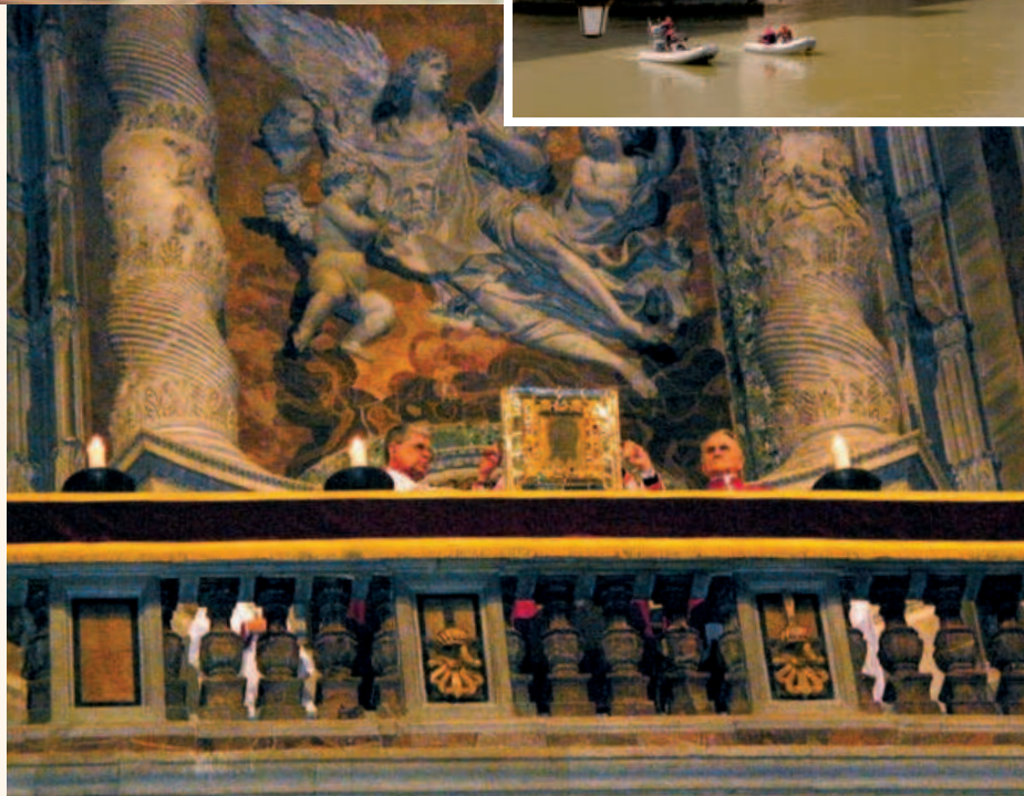
Презентація реліквії Вероніки у Страсну Неділю 2005 р.

Данте Аліг'єрі (1265-1321) у своєму творі « Vita nuova » писав, що юрби людей приходили подивитися на Божественний Лик Христа, зображений на Платі Вероніки. У « Божественній комедії » він неодноразово згадує хустку, підкреслюючи, що на ній відбито Божественний Лик. Кульмінаційним пунктом « Божественної комедії » була сцена, коли прочанин з'являється в небесах перед Богом, Який йому бачиться спершу як яскраве