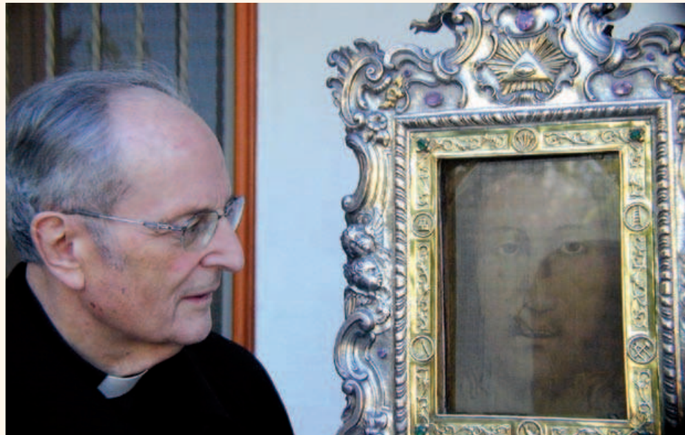
Кардинал Йоахим Майснер перед Платом в Манопелло 4 квітня 2005 року

Наукові дослідження однозначно підтверджують, що Плат (хустина), що зберігається в Манопелло, походить з Єрусалима. В результаті чудесного Воскресіння Христа з гробу на хустині залишився відбиток Обличчя Ісуса. Ймовірно, і Туринська Плащаниця, і Плат з Манопелло, який отримав назву «Плат Вероніки», до V століття зберігалися в місті Едесса, яке прийняло християнство в першому столітті н.е. (сьогодні це Урфа в південно-східній Туреччині).