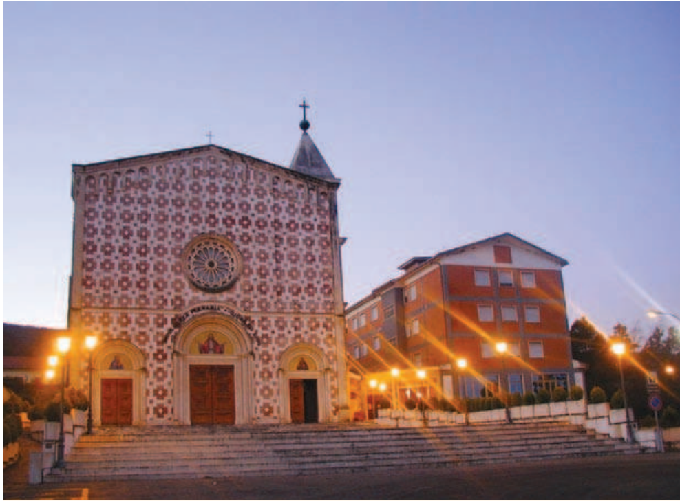
Храм Святого Обличчя в Манопелло

Християнство – це не форма культури, не ідеологія і не система ідеалів і принципів. Християнство – це Особистість. Християнство – це присутність. Християнство – це Обличчя. Християнство – це Ісус Христос!