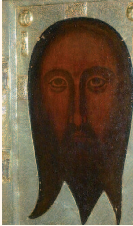
Образ із церкви Варфоломія в Генуї