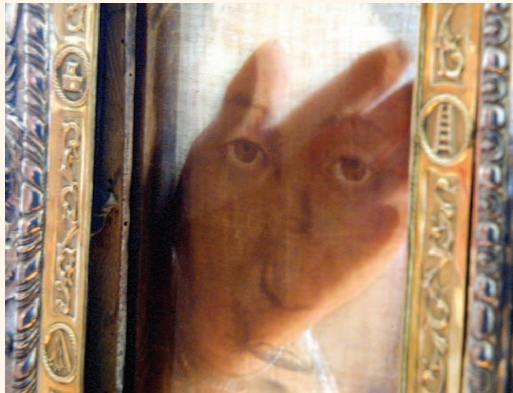
Найдивовижніша властивість Плата в тому, що він прозорий, Обличчя чітко вимальовується з обох боків, як на слайді

Ще в 1618 і 1620 роках на титульній сторінці друкованого видання « Opusculum de Sacrosanto Veronicae Sudario », написаного нотаріусом Якобом Грімальді, було поміщено зображення Божественного Обличчя із хустки Вероніки, таке саме, яким його малювали на всіх картинах. Але вже на книзі « Opusculum... », надрукованій в 1635 році,