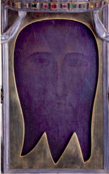
Мандиліон з Едесси, що знаходиться в Сикстинській капелі; багато вчених переконані, що це найбільш давнє зображення Ісуса Христа