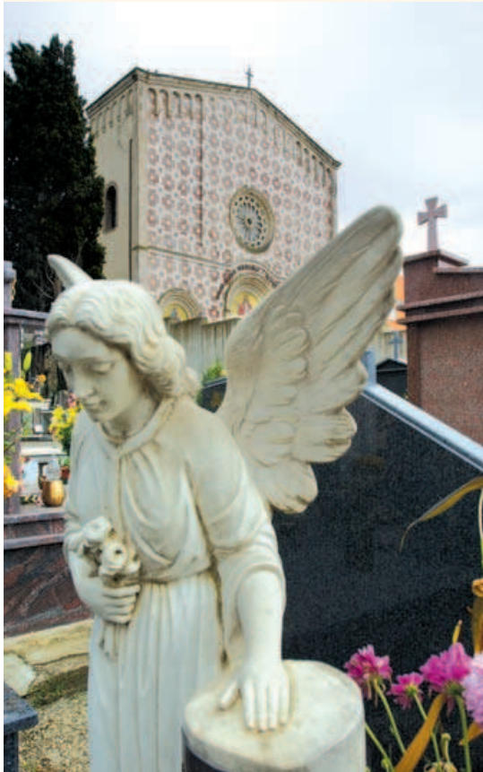
Церква Святого Обличчя в Манопелло

Стародавня легенда (VI століття) розповідає про відбиток Обличчя Христа, доставлений в Константинополь у 574 році з маленького містечка Камуліана, розташованого недалеко від Едесси. У тбіліських рукописах VI століття є інформація про те, що Богородиця після воскресіння свого Сина зберігала полотно з відбитком Його Обличчя, що з'явився на тканині, коли Ісус лежав у гробі. Автор тексту пояснює, що Бог дав Пресвятій Богородиці це полотно, аби могла молитися, споглядаючи Божественний Лик свого Сина.