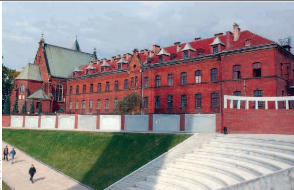
The old Lagiewniki convent where St. Faustina lived and died

“Ó, mily fájdalmas számomra, hogy a lelkek a Szentáldozásban oly kevéssé egyesülnek velem. Várom a lelkeket, de ők oly közömbösek irántam. Gyengéden és igazán szeretem őket, s ők nem hisznek nekem. Kegyelmeikkel akarom elárasztani őket – s ők nem akarják elfogadni ezeket. Úgy bánnak velem, mint valami holt dologgal, pedig szívem tele van szeretettel és irgalommal. Hogy legalább egy kissé megismerd fájdalmam, képzelj el egy anyát, aki nagyon szereti gyermekeit, de a gyerekek nem törődnek anyjuk sze-