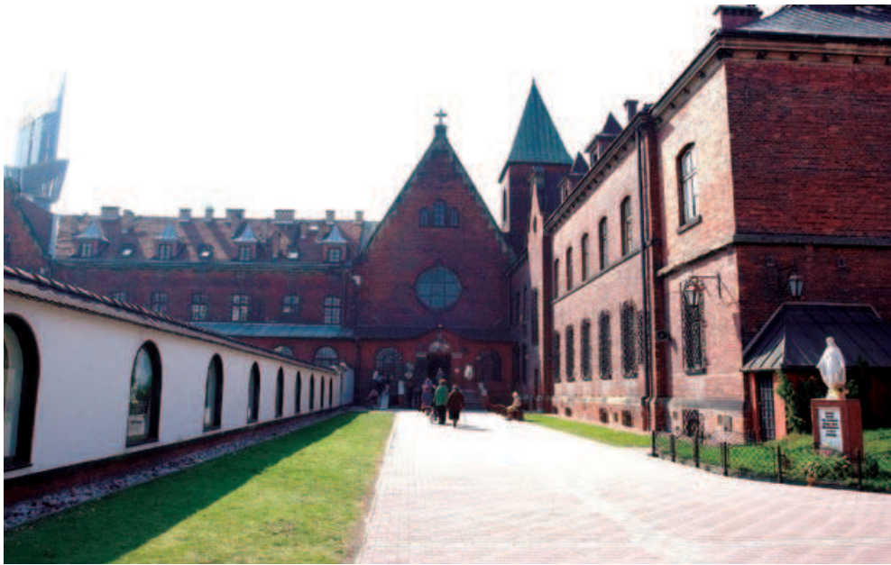
The old Lagiewniki convent where St. Faustina lived and died

tanítás Fausztina nővér Naplójában minden ember számára hozzáférhetővé vált. Ezekből a feljegyzésekből látható mennyire mély és gazdag volt misztikus kapcsolata Istennel. Nagy kegyelmekben és lelki ajándékokban volt része: elmélkedő imák, kinyilatkozások, jelenések, látnoki képesség, láthatatlan stigmák, az emberi lelkekbe látás adománya, és Isten irgalmasságának megismerése.