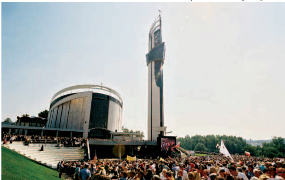
Nowa Bazylika Miłosierdzia Bożego w Lagiewnikach

Szt. Fausztina emlékeztet minket az oltáriszentség és a Szentháromság lényegére. “Jézus, ha a szentáldozásban hozzám jössz, (...) szívem kis mennyországában lakj, egész nap azon fáradozom, hogy társaságul szolgáljak Neked. Egyetlen pillanatra sem hagylak egyedül. Bár emberekkel vagyok, vagy a tanítványokkal, szívem mindig Hozzá kapcsolódik. Elalvás előtt felajánlom Neki szívem minden dobbanását, ébredéskor egy szót sem szólva elmélyedek Benne. Amikor felébredek, egy percig dicsérem a Szentháromságot, s megköszönöm, hogy újra nekem ajándékozott egy napot – hogy még egyszer végigmehet bennem Fiad Megtestesülésének titka, megismétlődhet szemeim előtt keserves szenvedésed. Ekkor arra törekszem, hogy rajtam keresztül megkönnyítsem Jézus útját a lelkekhez. Mindenhová Jézussal együtt megyek. Jelenléte mindenhová elkísér.” (486)