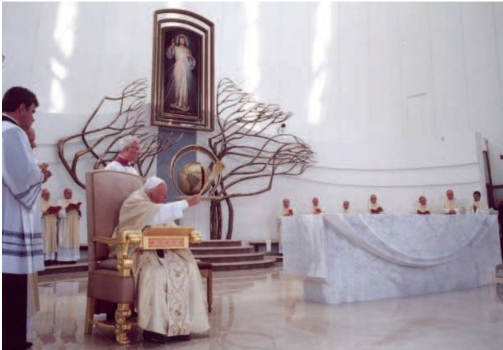
Poświęcenie nowej Bazyliki Miłosierdzia Bożego w Łagiewnikach przez Jana Pawła II