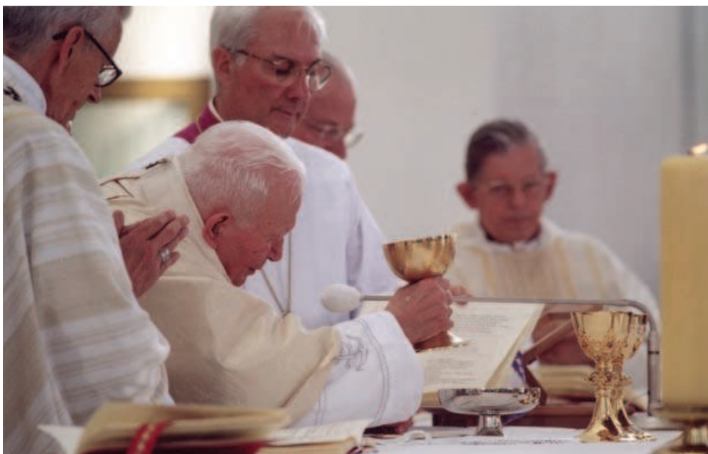
for. Archivum WSI