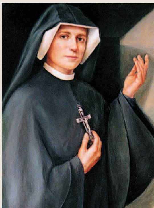
Portret siostry Faustyny

mális körülmények között 85 kiló volt a súlyom, a műtét miatt lefogytam 15-öt.