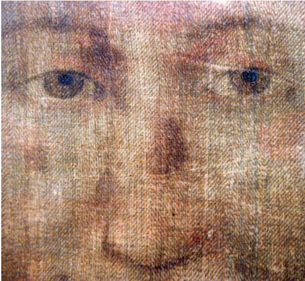
Suprapozícia – polozenie dvoch obrazov na seba: Tváre z Manoppella a podobizne z Turínskeho plátna. Potvrdzujú zhodu všetkých proporcií, dokonca aj rán.

Podľa židovskej tradície na dokázanie niečoho pred súdom boli potrební dvaja svedkovia. Aj tu máme dvoch svedkov, Jána a Petra, ale aj dva dôkazy, dva kúsky plátna: Turínske plátno a Tvár z Manoppella.