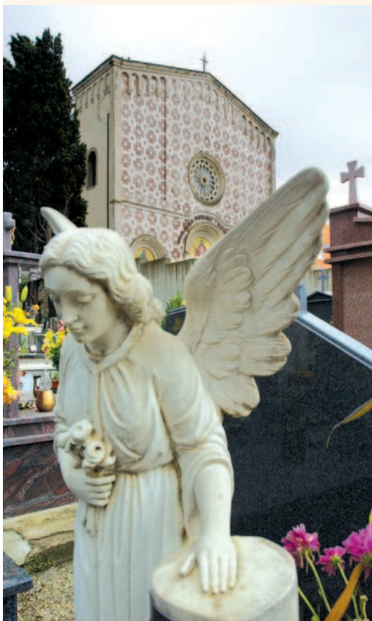
Kostol Svätej tváre v Manopelle.

Obyvatelia Manoppella sa vždy domnievali, že obraz Kristovej tváre v ich farskom kostole sa zázračne uchoval na šatke, ktorú mal Ježiš v hrobe položenú na hlave a bola svedkom zmŕtvychvstania.