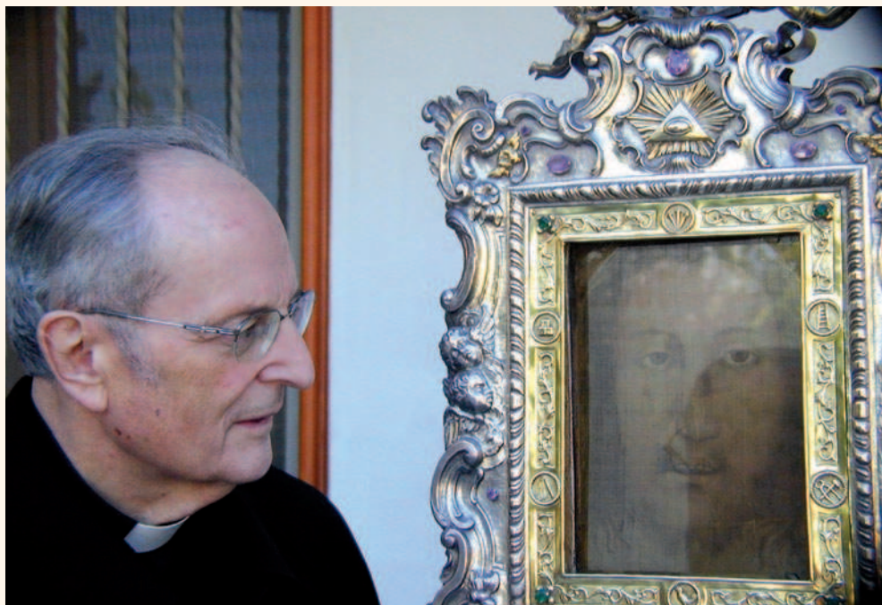
Kardinál Joachim Meisner pri plátne z Manoppella, 4. apríla 2005