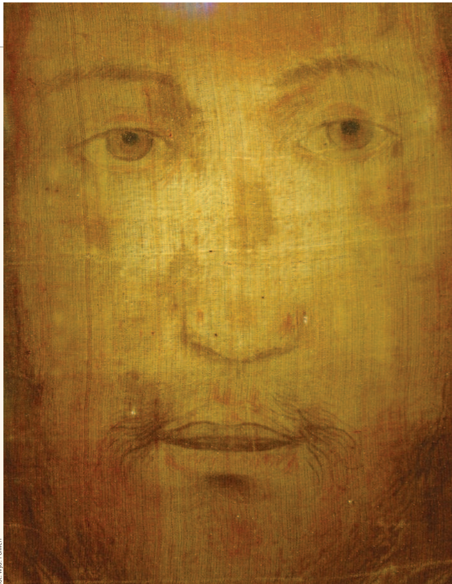
fat. wvd. Folwen

Zmŕtvychvstalý Ježiš nám zanechal neobyčajný znak svojho utrpenia, smrti a zmŕt-