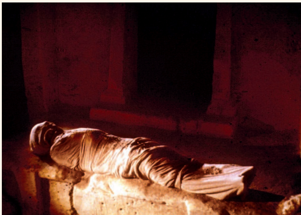
Pokus o rekonštrukciu spôsobu zavinutia Ježiša do pohrebných plachiet

Naopak na šatke z Manoppella zostal zachytený výraz tváre už žijúceho Ježiša vo fotografickom pozitíve, ale ešte pred