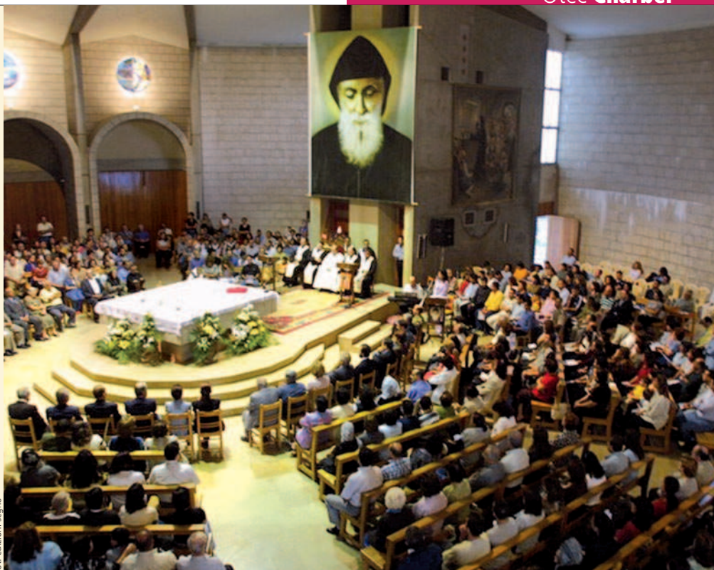
Kostol svätého Charbela