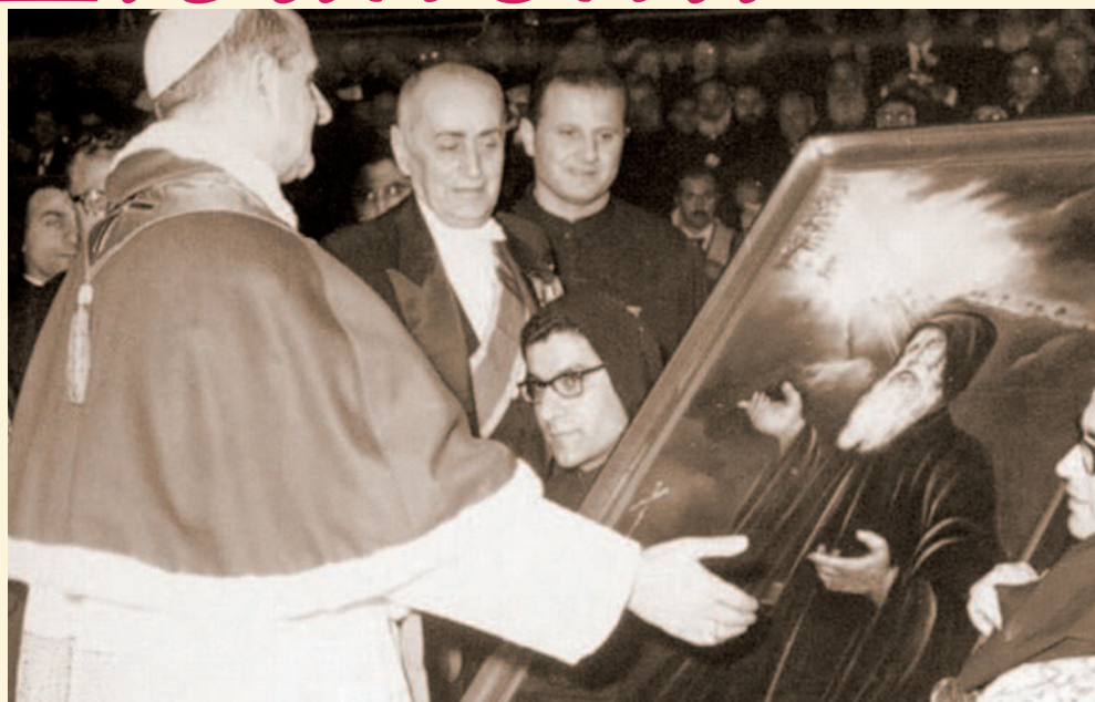
Pápež Pavol VI. pri beatifikačnom obraze otca Charbela

Pán Boh si vyberá niektorých ľudí, aby svetu neobyčajným spôsobom pripomínali jeho jestvovanie, jeho nesmiernu lásku a nekonečné milosrdenstvo. Jedným z nich je aj svätý Charbel Makhlouf (Šarbel Makhluuf), najznámejší svätec na Blízkom Východe. Vzbudzuje nadšenie a všeobecný údiv svojimi neobyčajnými zázrakmi a znameniami, ktoré sa skrze neho udiali.