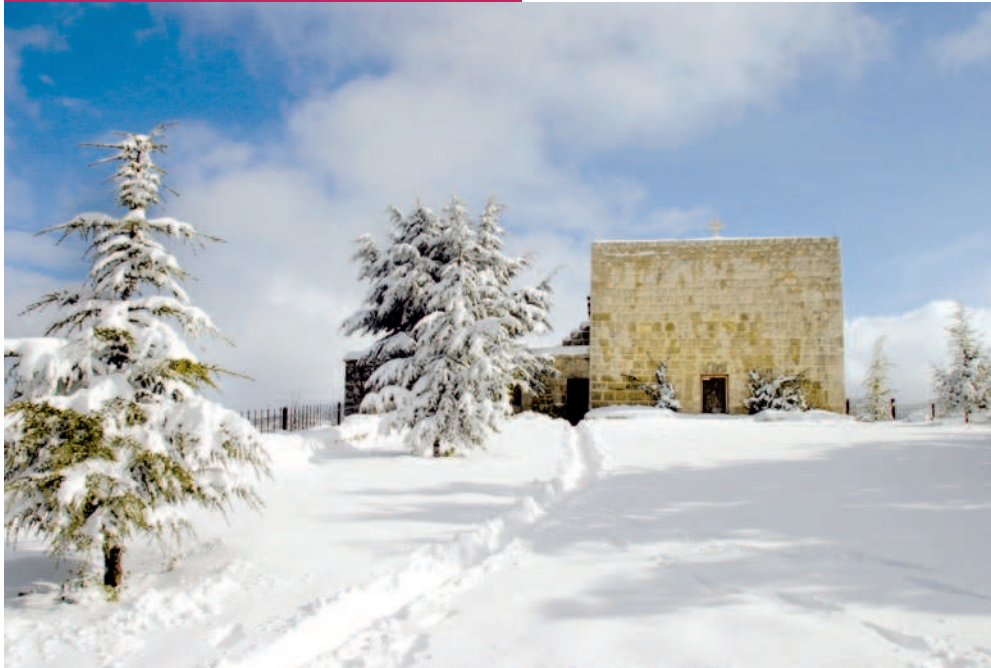
Pustovňa svätého Charbela

ho túžil mať Ježiš. Keď rehoľní spolubratia videli, ako hrdinsky nasleduje Ježiša, už za života ho považovali za svätého. Len niektorých ľudí povoláva Kristus na takúto životnú cestu, ale všetkých povoláva k svätosti. Preto žijeme na zemi, aby sme dozrievali pre lásku a pre nebo, aby sme sa učili milovať tak, ako miluje Kristus, a uskutočňovať v každodennom živote jeho najväčšie prikázanie: „Aby ste sa milovali navzájom. Aby ste sa aj vy vzájomne milovali, ako som ja miloval vás“ (Jn 13, 34).