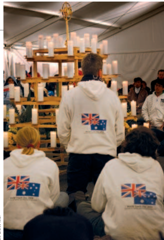
Adoračný stan, 19. júl 2008, Randwick

na neho – on je správcom Božích diel. Nechajte sa formovať jeho darom! (...) Snažte sa, aby vaša viera dozrievala skrze vaše štúdium a prácu, skrze šport, hudbu a umenie. Usilujte sa posilňovať ju modlitbou a život' sviatosťami, aby ste boli inšpiráciou a oporou pre všetkých okolo vás. Život nie je len hromadením dohier. Je niečím viac ako len dosahovaním úspechov. Skutočne žiť znamená podrobiť sa vnútornej premene, byť otvoreným na moc Božej lásky. Prijímajúc Ducha Svätého môžete aj vy premeniť vaše rodiny, spoločenstvá, národy. Oslobod'te tie dary! Nech sú múdrosť, sila, bázeň a nábožnosť znakmi vašej veľkosti!“