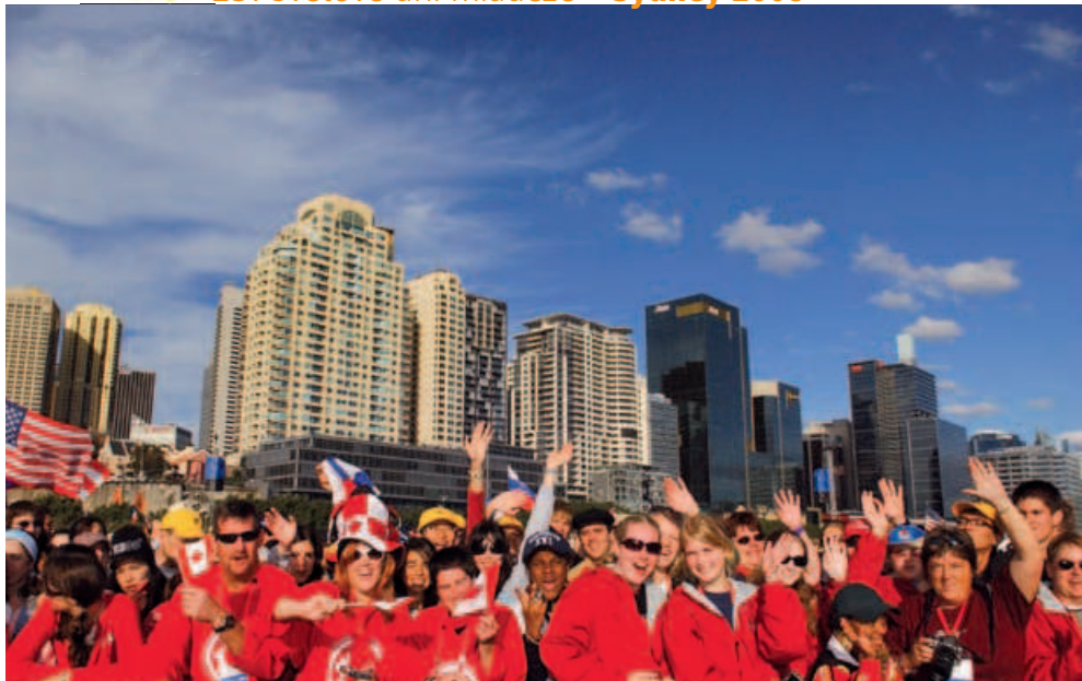
Stretnutie s Benediktom XVI., Barangaroo

„Zostúpi na vás Duch Svätý, dostanete silu.“ „Budete mi svedkami až po samý kraj zeme“ (porov. Sk 1, 8)