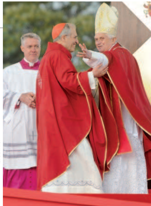
Benedikt XVI. s madridským kardinálom Antoniom M. Roucom