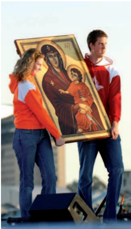
Ikona Panny Márie SDM