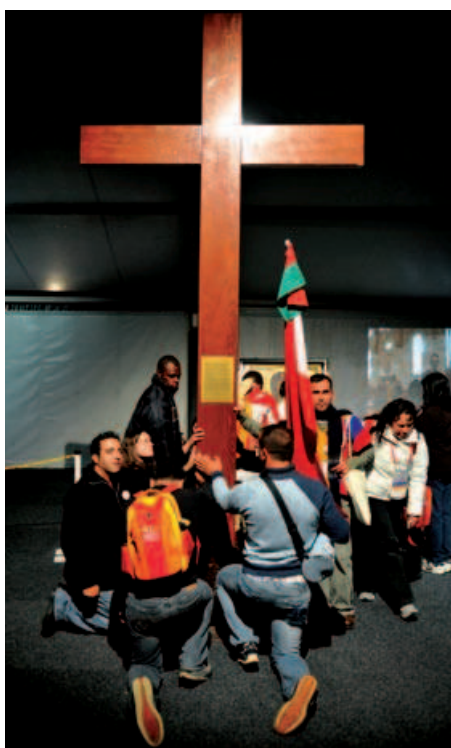
Poklona krížu SDM

Štvrtkové popoludnie prebiehalo v znamení slávnostného privítania pápeža Benedikta XVI. Svätý Otec sa plavil šesť morských míľ za veterného, ale slnečného počasia. Pápežskú loď sprevádzalo dvanásť menších lodí a na nich 1200 mladých pútnikov a novinárov. Za nadšeného kriku mládeže pápežská loď zakotvila v prístave Barangaroo, kde sa uskutočnilo večerné stretnutie mladých ľudí so Svätým Otcem.