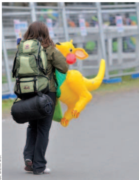
fol. archiv MSI

Tento úkon zasvätenia sa Ježišovi sa modli každý deň, aby si nezabudol na prijaté záväzky, zvlášť na to, že nikdy sa netreba nechať znechutiť a hneď vstať z každého pádu. Prosím ťa, aby si našu