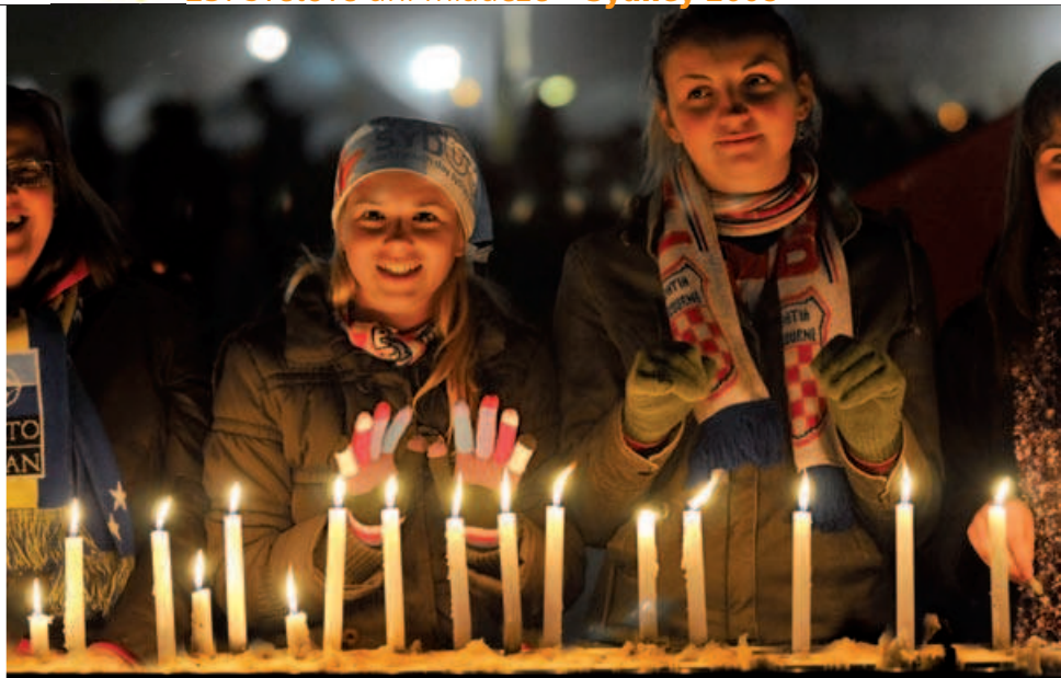
Nočné bdenie na Randwicku

ho ničíme“, v ktorom „láska nebude sebecká, ale čistá, verná a úprimne slobodná, otvorená voči druhým a rešpektujúca ich dôstojnosť, láska, ktorá chce ich dobro a vyžaruje radosť a krásu“. K budovaniu sveta, v ktorom „nás nádej oslobodí od povrchnosti, apatie a uzavretosti, ktoré umŕtvujú naše duše a ničia ľudské vzťahy... Svet potrebuje túto