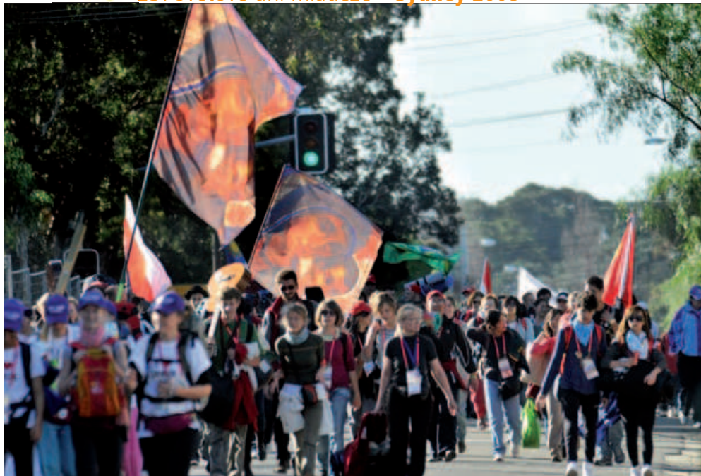
19. júl 2008, pútníci cestou na Randwick