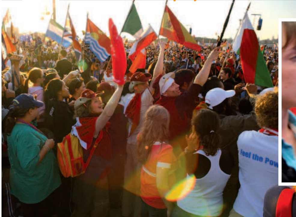
Úvodná svätá omša SDM