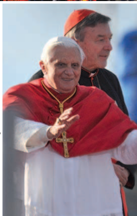
Benedikt XVI. a kardinál George Pell

Boh je s nami – nie v našich predstavách, ale v realite nášho života! My sa chceme so skutočnosťou popasovať, nie od nej utekať, usilujeme sa pozrieť jej do očí