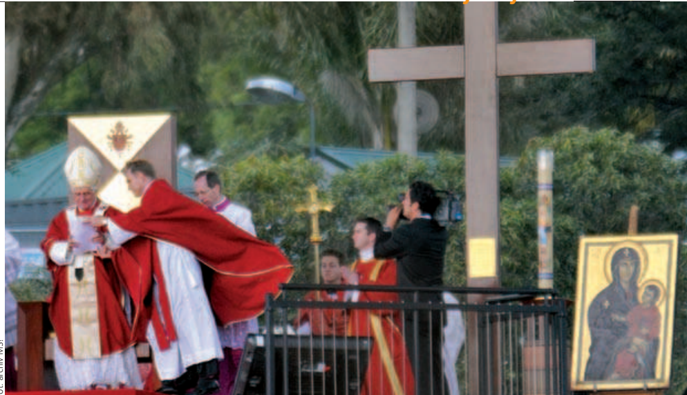
Dopoludňajšia svätá omša na záver SDM, 20. júla 2008, Randwick

Panna Mária, moja Matka, veď ma po cestách viery k samému prameňu